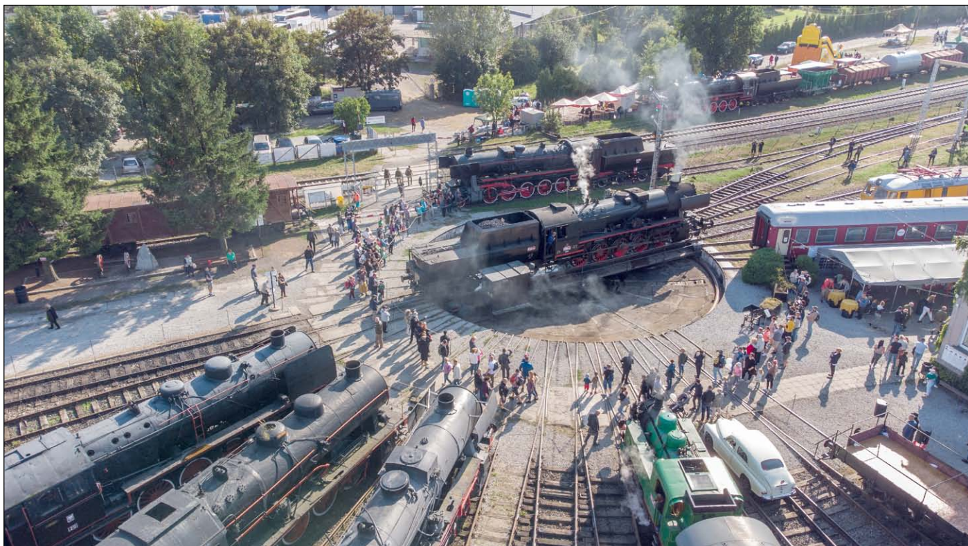
Eisenbahnmuseum in Königszelt aus der Vogelperspektive