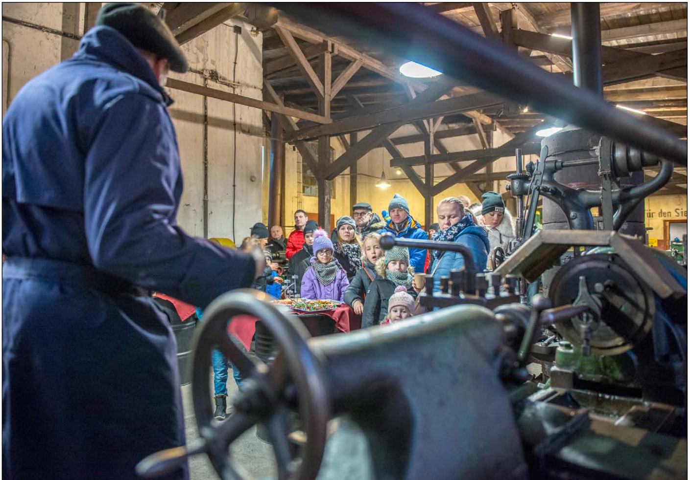
Maschinenschau in einer historischen Werkstatt