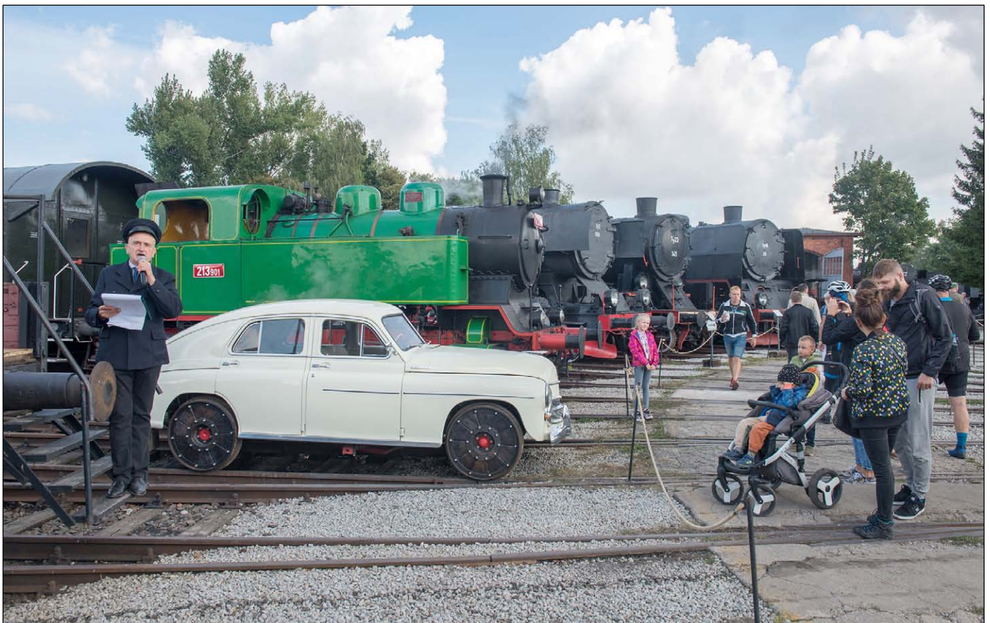
Dampflokomotiven im Museum

Heute beherbergt das Museum eine Sammlung von Lokomotiven und Waggons verschiedener Hersteller aus der Zeit vom 19. Jahrhundert bis zur Gegenwart. Die Exponate können im restaurierten Lokschuppen und auf dem Museumsgelände bewundert werden. Seit einem Jahr kann man auch eine Reparaturwerkstatt vom Anfang des 20. Jahrhunderts besichtigen, die mit historischen immer noch funktionierenden Metallbearbeitungsmaschinen ausgestattet ist. Eisenbahninterieurs aus verschiedenen Epochen sind ebenso zu besichtigen wie eine große Eisenbahntrappe, die mit Originalausrüstungen aus der Zeit um die Jahrhundertwende gesteuert wird. Auch auf die kleinen Besucher warten zahlreiche Attraktionen, angefangen von einem Spielplatz bis hin zur Dampflokomotive „Thomas“, die aus dem beliebten Kinderfilm „Thomas & seine Freun-